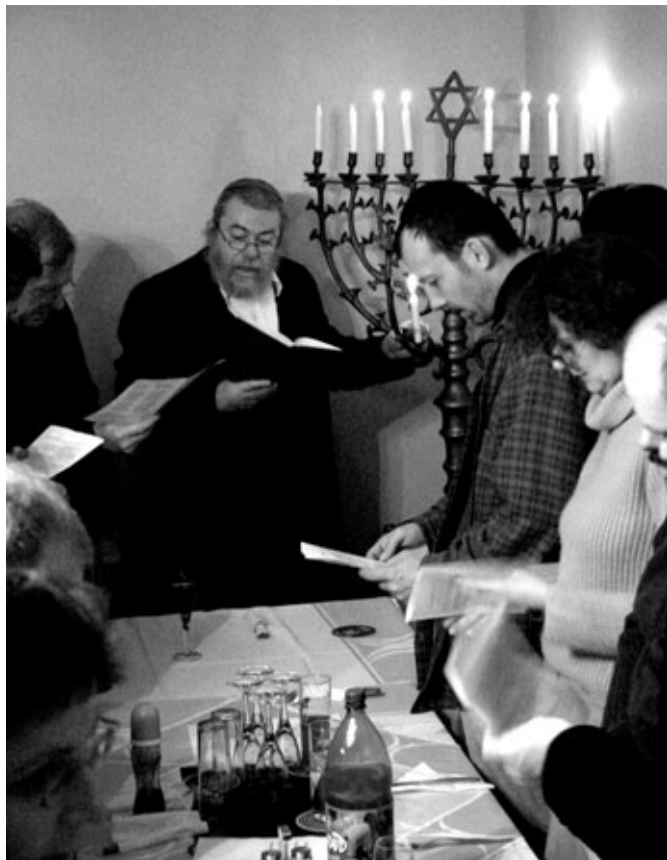
Teplickou obec navštívil v prosince u příležitosti svátku Chanuka vrchní zemský rabín Karol Sidon

e-mail: kehila@volny.cz , www.kehila-teplice.cz