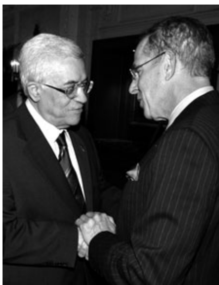
Podporuje Mahmud Abbas (vlevo) Ženevskou výzvu?

Zrovna před rokem uveřejnilo asi 250 izraelských a palestinských známých veřejných osobností prohlášení, které vešlo ve známost světové veřejnosti jako „Ženevská výzva“. Je to detailně propracovaný návrh dohody na palestinsko-izraelské mírové urovnání. Jmenuje se „Ženevská“, protože první setkání se konala v Ženevě z iniciativy švýcarské vlády; a „výzva“ – protože dokumentuje, že dohoda je možná a tudíž představuje výzvu vládám, aby se dohodly – na základě principů prohlášení, nebo jakýchkoli jiných principů, jež poslouží jako základ dohody.