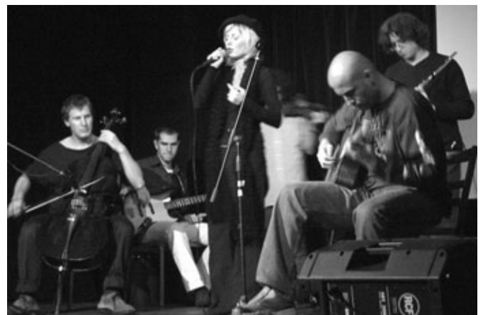
V rámci akce proběhl i komponovaný pořad, složený z individuálních vystoupení mladých umělců