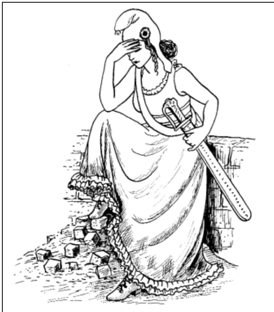
kreslila Lucie Lomová

Většina výtržníků byla údajně dětmi Afričanů, daleko méně Arabů, o jiných etnických skupinách nemluvě, byly zanedbatelné. Dotykáme se citlivého tématu, jež politicky korektní jazyk těžko unese. Jsou-li ve školách děti původem z Asie mezi prvními (jako tomu začíná být i v Čechách) a mezi násilníky nefigurovaly, mají děti (tedy kluci) s africkými kořeny největší problémy, nejhůř se integrují. Toto konstatování, jež zná každý učitel, ale jež se neodvážní vyslovit na poradě, nemá nic společného s rasismem. Odborníci je znají a analýza specifity afrického přistěhovalectví jim umožní hledat příčiny a způsob, jak s nimi nakládat.