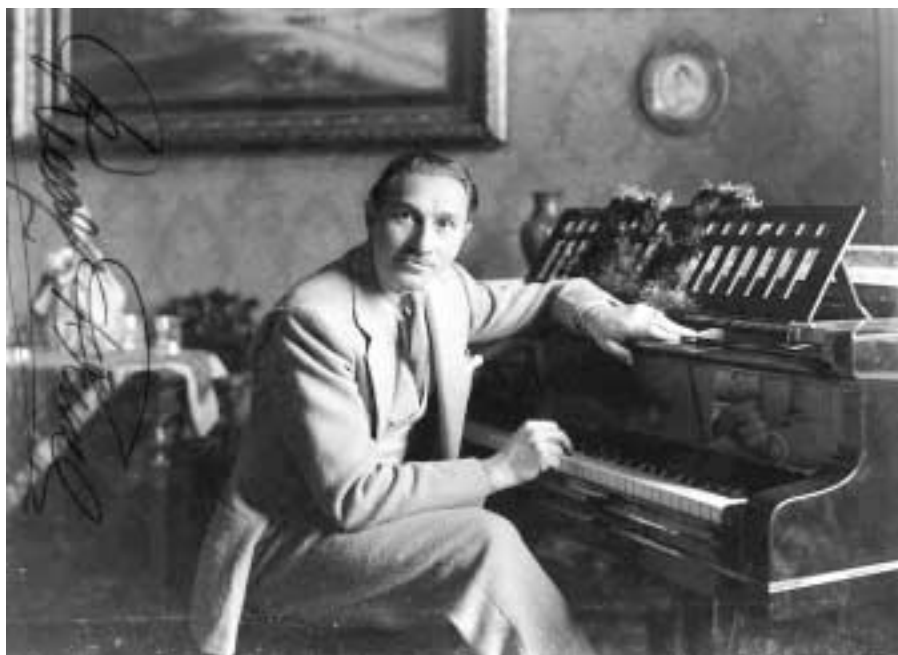
Rudolf Friml ve svém newyorském bytě (okolo 1925)