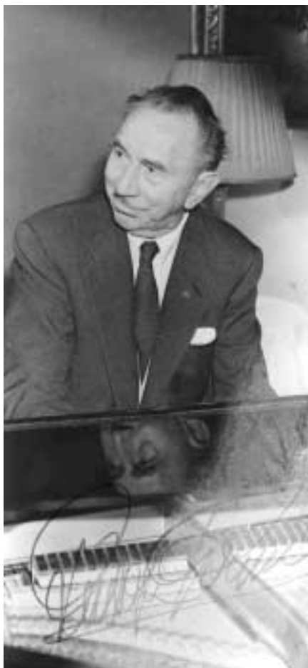
Friml rád hrál i zpíval pro své přátele. (okolo 1940)

dobro slavilo triumf a láska vše korunovala. „Touhu svou a žár svěřuji nočním tmám“ zpívá sirotek Rose Mary, a zlatokop Jim replikuje „Ó Rose Mary, buď mojí, tvůj úsměv rány zhojí.“ Jak je z malé ukázky patrné, nezůstalo nad příběhem ani jedno oko suché, popularita operety byla vpravdě fenomenální. Hrála se s obrovským úspěchem v Paříži, Londýně, Helsinkách, Římě, Kodani a roku 1928 byla zfilmována s tehdejší superstar Joan Crawford v roli Rose Mary. Další slavný filmový přepis je z roku 1936 s Jeanette MacDonald, v roce 1954 následoval televizní remake pod názvem Indian Love Call a i dnes je Rose Mary stálicí. Byla např. uvedena v roce 1999 na festivalu v Terstu v sousedství Hallo, Dolly a Cikánského barona. Slávu ale sklízely i další Frimlovy operety. Z nich si asi největší úspěch vydobyl Král tuláků. Příběh pařížského básníka a rebela Villona je vděčným tématem, s kterým se v moderní době dějou všelijaké podivnosti. Tato opereta se považuje za vrchol Frimlovy tvorby, byla v roce