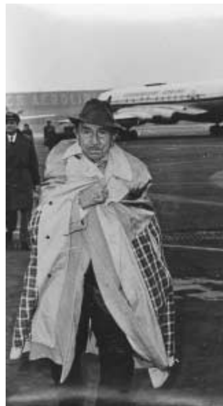
Friml po přeletu do Prahy (1966) pózuje jako „Král tuláků“.

Rose Mary se zrodila v době okouzlení romantickou poetikou Divokého západu, které souviselo i s rozmachem německého filmu. První kovbojky byly natočeny okolo roku 1910 a už tehdy měly známé klišé: kladného a záporného hrdinu, odvážnou dívku, šerifa a bázlivého barmana. Zlotřilost a proradné charaktery byly vždy potrestány,