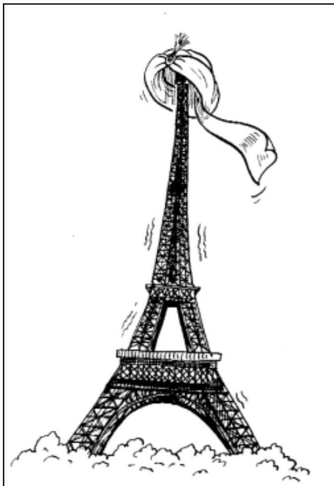
kreslila Lucie Lomová

Poprvé v moderních dějinách Francie se objevuje skupina, která je méně integrovaná než její rodiče, která odmítá být Fran-