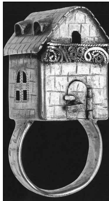
SVATEBNÍ PRSTEN, POLOVINA 19. STOLETÍ.

Prsten z majetku synagogy byl snoubencům na svatební obřad pouze zapůjčován. Tvar domu je symbolem budoucího společného domova novomanželů.