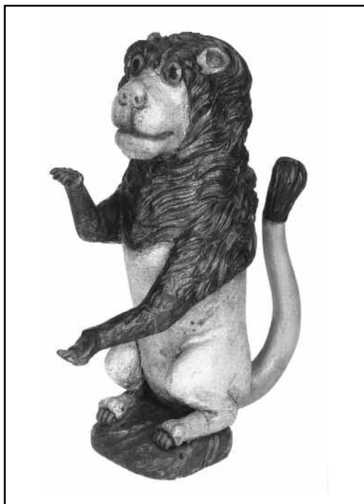
LEV Z NÁSTAVBY ARONU, KOLEM ROKU 1820. Figury sedících lvů byly kdysi součástí ozdobné nástavby skříně na Tóru. Roztažené tlapy napovídají, že lev přidržel korunu nebo desky Desatera. Krásný příklad lidové řezby.

Výstava sama o sobě byla přehlídkou nádherných věcí, které dávaly tušit jak cenné a dnes již nenahraditelné poklady, jsou v depozitech muzea uloženy, aby mohly i dalším generacím zprostředkovat plastický obraz života českých a moravských Židů do druhé světové války. Bylo šťastným rozhod-