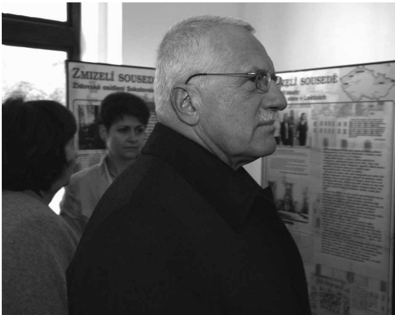
Prezident Václav Klaus s chotí shlédli výstavu „Zmizelí sousedé“ s velkým zaujetím.

opět staly místem důstojného odpočinku našich předků. Za velkého zájmu veřejnosti pořádají tepličtí Židé různé akce, z nichž můžeme namátkou jmenovat pravidelně se opakující Dny židovské kuchyně, výstavu o porcelánce v Dubí, spolupráci s místními školami, akci „Hledáme bývalé členy“, „Zmizelí sousedé“ a samozřejmě dramaturgii výstavní síně v zachráněném objektu hřbitova v Mostě-Souši. Obec má svůj společenský klub, výstavní síně, pořádá kon-