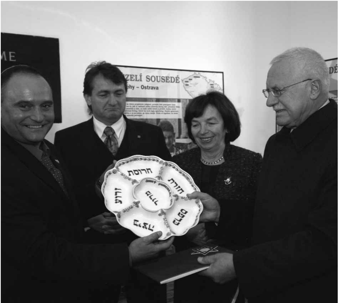
Prezidentský pár ukazuje dar od Židovské obce – porcelánovou sederovou mísu vyrobenou v porcelánce v Dubí.