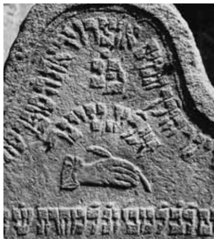
Obr. 9 Náhrobek Zeliga Theinera, 1838, židovský hřbitov, Votice, okres Benešov, detail

Několik náhrobních kamenů s téměř identickým motivem pokladničky, kterou přidržuje ruka jejího správce, nacházíme na jižní Moravě ve 2. čtvrtině 19. století. Všechny osoby, jimž náhrobky patří, byly správcové pokladny, většina působila v čele