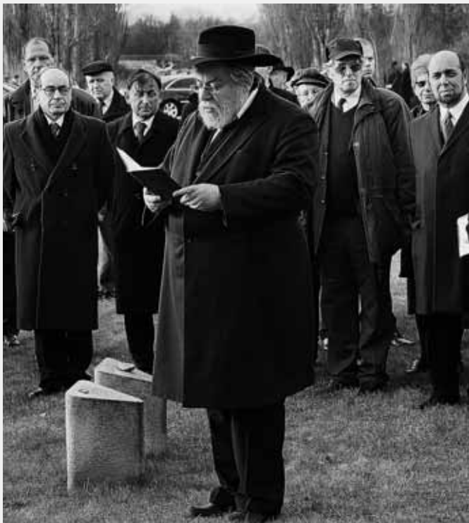
Vrchní zemský rabín Efraim K. Sidon při modlitbě Kadiš na židovském hřbitově v Terezíně

promisní ujištění, že pro zvěrstva holocaustu neexistuje žádné rozehřešení, usmíření, zapomnění ani promlčecí doba. Poté se hosté s doprovodem a návštěvníci setkání přemístili na hřbitov, kde státníci k památníku zemřelých položili věnec a podle židovského zvyku umístili kamínky. Za všechny zemřelé se pomodlil vrchní zemský a pražský rabín Efraim K. Sidon.