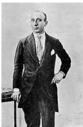
Leopold Hilsner – foto po propuštění z 19leté vazby

Často a hojně je zmiňována ve vědeckých kruzích konference uspořádaná v roce 1999 Univerzitou Karlovou a Židovským muzeem v Praze na téma „Leopold Hilsner a česká společnost 1899“. Výtečný sborník, obsahující například omluvu městské rady Polné z roku 2002 Židům za zločiny spáchané v souvislosti s hilsneriádou či zmíněné rozhodnutí ministryně Parkanové, je dávno vyprodán a mezi badateli žádan. Druhé vydání či aspoň reprint jsou však v nedohlednu. Proč?