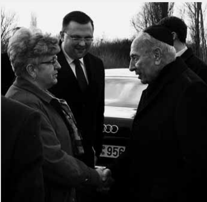
Po ukončeném obřadu si prezident Šimon Peres našel chvíli na neformální rozhovor s účastníky setkání