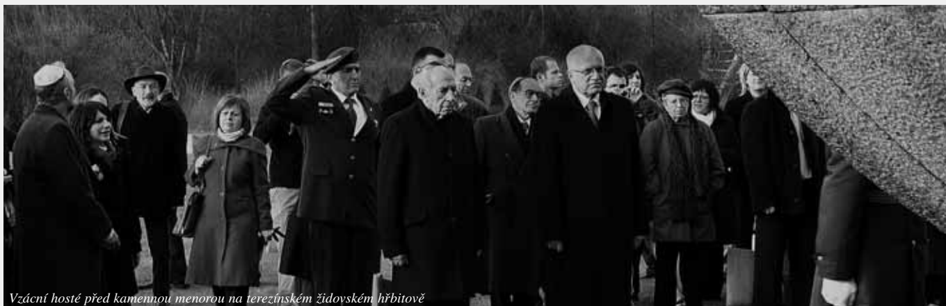
Vzácní hosté před kamennou menorou na terezínském židovském hřbitově