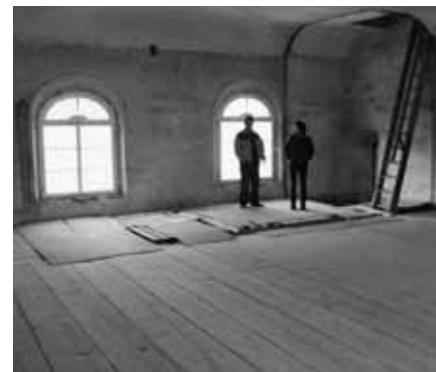
Také interiér prochází náročnou rekonstrukcí

Společnost pro obnovu synagogy ve Čkyni, o.p.s., Obecní úřad ve Čkyni