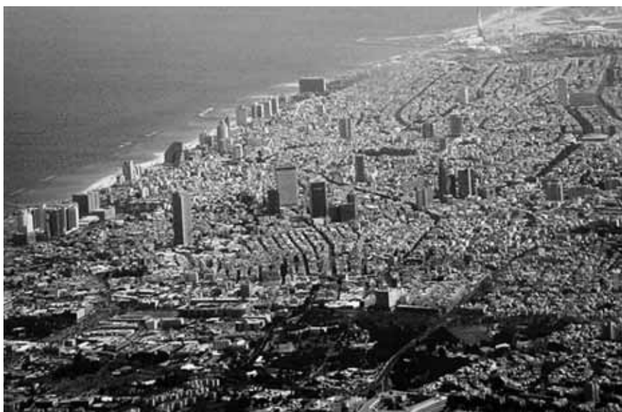
Dnešní Tel Aviv

V dubnu 1921 se v Tel Avivu konal první sjezd hebrejských spisovatelů Erec Jisrael.