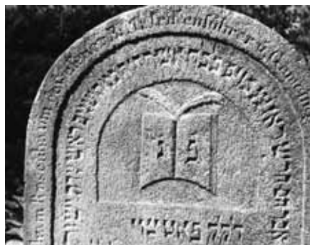
Obr. 7 Náhrobek Abrahama Rosenbauma, 1853, židovský hřbitov, Pacov, okres Pelhřimov, detail

Znamením, které v některých případech označuje činnost rabína, je motiv knihy. Na Starém židovském hřbitově se vyskytuje od počátku 17. století na náhrobcích kantorů (předzpěváků v synagoze): např. v kombinaci s medvědem – symbolem jména – na náhrobku Jissachara Bera Chazana (1625) nebo na dvojnáhrobku pro kantora Abrahama, syna Jisraela Isserla (1628).