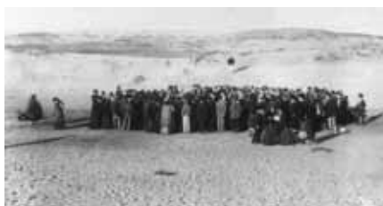
11. dubna 1909 se na písčítých dunách severovýchodně od Jafy sešlo 66 rodin, aby si rozlosovaly parcely.

Dnešní Tel Aviv je střediskem mezinárodního byznysu a bankovníctví, je sídlem diamantové burzy, v jeho blízkém okolí se soustředily izraelské a mezinárodní závody vysokých technologií – hi-tech. Tel Aviv je městem bezpočtu kaváren, mezi nimiž