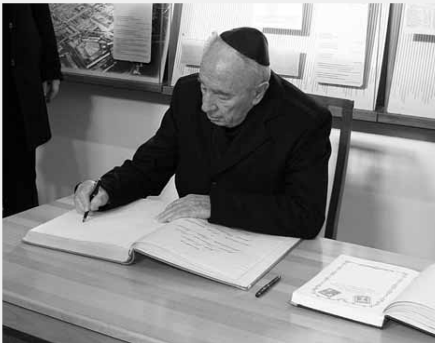
Prezident Šimon Peres se podepisuje do pamětní knihy terezínského krematoria