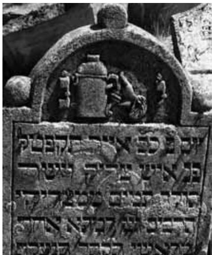
Obr. 10 Náhrobek Davida, syna Šimona Koritschone-ra, 1829, židovský hřbitov, Mikulov, 1829, detail

používání motivu pokladničky coby dokladu činnosti pohřbeného pokračuje v Ivančicích ještě ve 2. polovině 19. století.