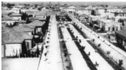
Rothschild Boulevard v roce 1913

zení (kromě možnosti parkování, která je téměř nulová), městě nezbožném a mnohdy až bezbožném a provokativním. Pro mnohé Izraelece je Tel Aviv „ ir chilonit – světské město “. Na první pohled to tak opravdu je. V Tel Avivu nepocítíte onu mystickou svatost Jeruzaléma a jste na míle vzdáleni benejbrackému „ghettu“, které je však odtud coby kamenem dohodil. Stačí se však podí-