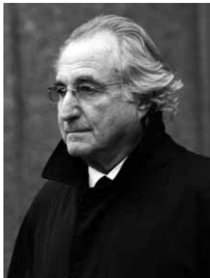
Bernard Madoff, největší podvodník v dějinách

Nyní dřepí v cele, z níž se na rozdíl od jiných podvodníků už nikdy asi ven nedostane. O to se postará velikánská obec okradených, která se již teď tuze snaží znemožnit přesuny fondů v rodině: paní manželce Madoffové, jeho původní sekretářce, sto milionů (o nichž tvrdila, že to je dědictví po jejím otci, který jí zanechal pár tisícovek), dva synové a jeden bratr, všichni zaměstnaní v téže šejdířské