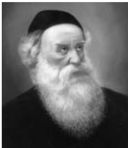
Šneur Zalman z Ljady, zvaný Admor ha-zaken

Měsíc elul, jak bylo již výše zmíněno, je příhodnou dobou pro návrat k Bohu a plnění jeho přikázání. Jako bychom slyšeli slova proroka Hósei (Ozeáše): „Navrať se, Izraeli, k Hospodinu, svému Bohu, neboť jsi upadl pro svoji nepravost. Vezměte s sebou tato slova, obraťte se k Hospodinu, řekněte mu: Promiň nám všechnu nepravost, přijmi nás laskavě, když chceme oběti býčků nahradit svými rty.“ (Oz 14,2-3). Mnozí nezbožní, ale i zbožní Židé mají ne zcela jasnou představu