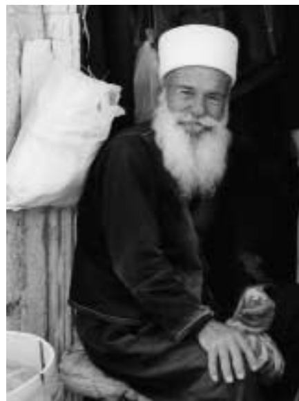
Věřící Drúzové nosí velmi specifické oblečení

Hovoříme tady o národu, který žije tisíc let v náboženské a národnostní samostatnosti (od počátku založení náboženství Drúzů v 11. st.) uvnitř uzavřené společnosti, a to z mnoha důvodů. Především ale kvůli touze uchránit svou bezpečnost, své hodnoty a náboženství. O Drúzích toho nebylo napsáno mnoho, ale přesto v nich spousta sociologů, historiků a vědců, kteří se jimi zabývali, spatřuje jedinečný národ, který se liší od ostatních národů. Náboženství Drúzů vzniklo v Egyptě v 11. století, v době vlády Fatimovců, jako nové a samostatné náboženství, na kterém je nejvýraznější jeho nábožensko-politický základ