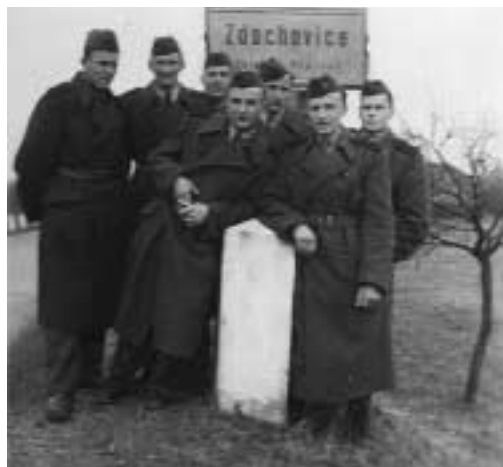
Vojáci PTP ve Zdechovicích na vycházce, rovněž rok 1953