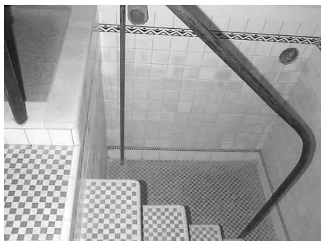
I reformní konvertité absolvují všechny tradiční procedury, včetně ponoření do mikve