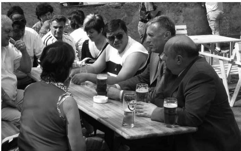
Mirek Topolánek na neformální besedě s romskými aktivisty

postihovat, jeho nositele lze pokutovat a třeba i odsoudit a zavřít. Na druhé straně však existuje (i v tak tolerantní společnosti) určitý latentní antisemitismus, proti kterému je nutno vystupovat také, ale je to spíše otázka dobrých učebnic a slušných učitelů. Příčiny antisemitismu jsou samozřejmě složité, se silným historickým kontextem. Velmi zjednodušeným, ale nikoliv zcela nesprávným vysvětlením, je velká úspěšnost celé komunity, jsou to chytří lidé, kteří ve svých oborech dosahují znamenitých výsledků, a to se následně pojí i s jejich lepším sociálním postavením. U primitivních lidí pak vzniká závist a od závisti je jen malý krůček k nenávisti. Bohužel závist je věčná a nesmětuje jen vůči Židům, ale postihuje vše, co dosahuje úspěchu. Jinak je antisemitismus dobrým politickým trikem, když ve společnosti něco přestane fungovat a hledá se viník. Známe to konečně z literatury, jak v době největší bídy vznikaly v Rusku pogromy, protože to byl hromosvod, který odvedl pozornost lidí od pravých příčin jejich strádání. Obdobné to bylo v Polsku, kde je antisemitismus dodnes mnohem palčivějším problémem, než kdy byl u nás, ale navenek si to Poláci moc nepřiznávají. Česko je naopak země s nízkou religiozitou, jsme hodně sekulární, nekonfesní, náboženská tolerance je nám historicky dána a i to je příčinou, proč je antisemitismus v Čechách celkem nevýrazným jevem, o čemž jsem hluboce přesvědčen.