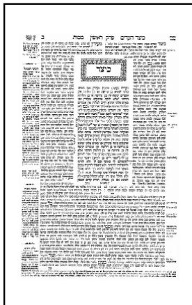
Ústní tradice se vyvíjela celá staletí. To je zřejmé i z pohledu na stránku Talmudu.

Svátek Šavuot, který každoročně slavíme 6. a 7. sivanu (letos 2. a 3. června),