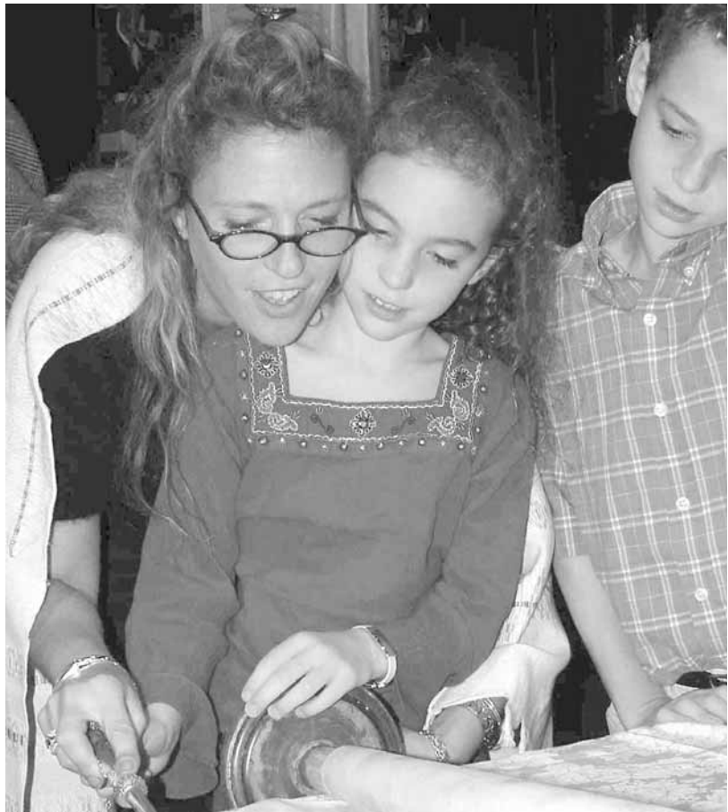
Celá rodina musí žít aktivním židovským životem a dítě musí dostat židovské vzdělání.

Podivná, nicméně často opakovaná výtka zní, že progresivní judaismus klade větší důraz na sociální činnost než na náboženství. Je to podivné, protože v judaismu jsou náboženství a sociální spravedlnost jedno a totéž. Rabíni nás učí, že Tóra 36krát opa-