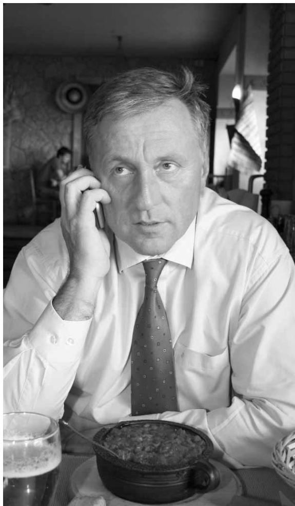
Ani oběd není pro Mirka Topolánka odpočinkem

Dohodli jsme si schůzku v mexické restauraci. Proti mně sedí uvolněný, klidný a příjemně sebevědomý muž, který před několika dny oslavil padesátku. Na jeho chování není rozhodně poznat, že je jedním z protagonistů letošní velmi tvrdé volební kampaně. „Nejste ani trochu nervózní,” konstatuji a Mirek Topolánek s úsměvem říká: „Jsem politik a volby jsou neoddělitelnou součástí mé práce, stejně jako váš rozhovor se mnou.“