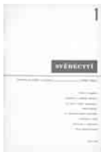
Faksimile obálky vzácného prvního čísla časopisu Svědectví, které vyšlo v zimě roku 1956. (2)