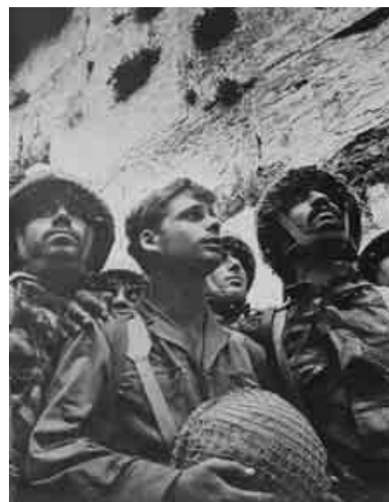
Známa fotografie z roku 1967 – izraelský parašutista u Zdi nářků.

Na celých devatenáct let Jeruzalém osiřel. Osiřel Jeruzalém krále Davida, který si jej zvolil za své sídelní město a za hlavní město všech dvanácti izraelských kmenů. Osiřel Jeruzalém Šalomounův s horou Moria, na níž kdysi stával jeho velkolepý Chrám zasvěcený Hospodinu. Osiřela i Zeď nářků (Kotel ha-maaravi), k níž v dobách radosti i smutku přicházeli Židé a odkud se jejich modlitby vznášely k nebesům. Snad nikdo ze současných moderních umělců nevystihl lépe opuštěnost Jeruzaléma jako textařka Naomi Šemer z.l. (1930–2004) ve