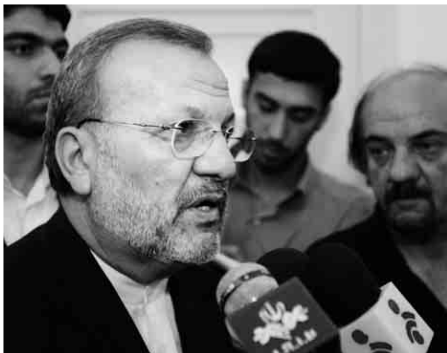
Íránský ministr zahraničí Mottakí: „Pokud dojde konference k závěru, že se holocaust skutečně odehrál, přijmu tento fakt.“ Jakpak to asi dopadlo?

Tak jako se Hitler podle svého názoru pokoušel vražděním Židů „osvobodit“ lidstvo, i Ahmadínežád věří, že může lidstvo ►