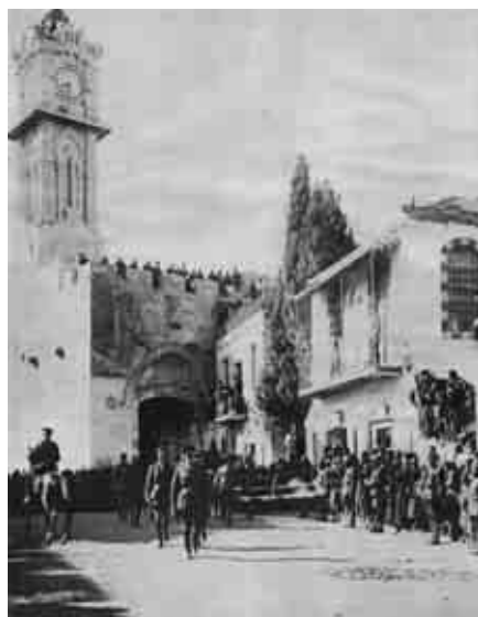
První světová válka – britský generál Allenby vstupuje Jaffskou bránou do Jeruzaléma.

První událostí byl 5. ijar 5708 (14. květen 1948), kdy Národní rada jiživu v Palestině pod předsednictvím Davida ben Guriona vyhláší v Tel Avivu nezávislost Státu Izrael. Prohlášení nezávislosti umožnila skutečnost, že tehdejší židovská reprezentace,