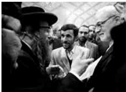
Íránský prezident Ahmadínežád se srdečně zdraví se židovskými účastníky konference o „revizi“ historického pohledu na holocaustu – zástupci Neturej karta.

šedesát let neustále klame lidstvo. Kdo mluví o „takzvaném“ holocaustu, předpokládá, že přes 90 % kateder a médií na světě kontrolují Židé a hermeticky je uzavírají před „skutečnou“ pravdou. Kdo obviňuje Židy z takových zločinů, nemůže dost dobře kritizovat Hitlerovo konečné řešení. Už proto je v každém popírání holocaustu implicitně obsažena výzva k jeho opakování.